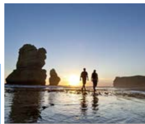
Plage des 12 Apôtres - Australie